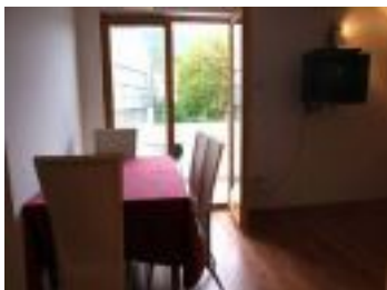
Sto za rucavanje

Vlasnik Oglasa: Apartmani Natasa Soko Banja