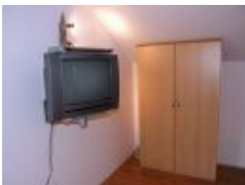
TV sa kablovskom