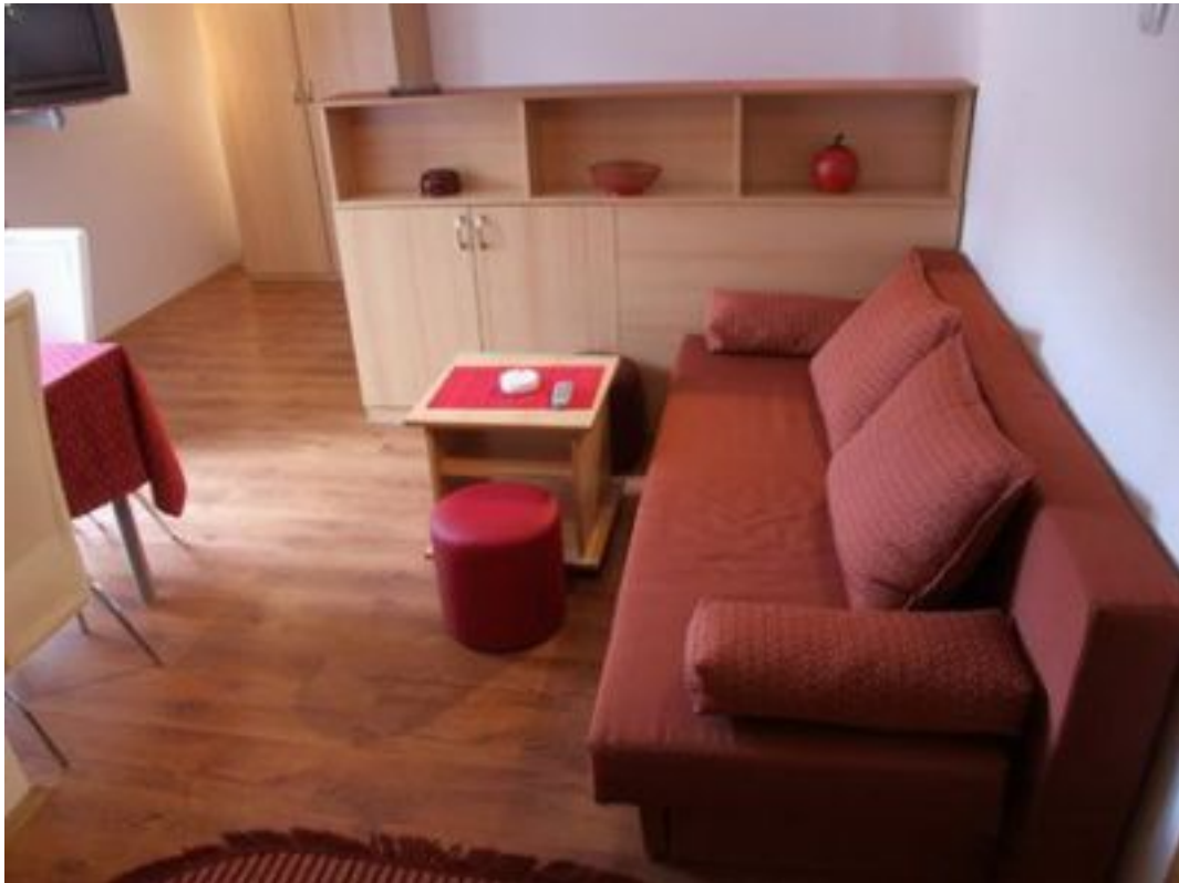
Kauc na rasklapanje

Apartmani Natasa Soko Banja <sokobanjavocar@gmail.com> - 063/357-255 petak, 27 maj 2011 11:09 - Poslednje ažurirano petak, 27 maj 2011 11:15