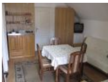
Sto za rucavanje

Vlasnik Oglasa: Apartmani Neli Soko Banja