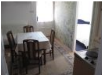
Sto za rucavanje

Apartmani Neli Soko Banja <marketing@sokobanja.org> - 065/550-76-76 subota, 14 maj 2011 12:12 - Poslednje ažurirano subota, 14 maj 2011 12:19